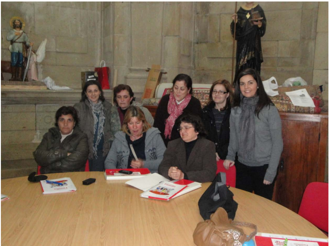
Madres que participan en la escuela de familia.

¿Cómo son las reuniones? Son reuniones dinámicas y flexibles van construyendo sus propios conocimientos para poder afrontar la resolución de los problemas de la vida cotidiana. Y por último ¿Cuándo son? Pues son cada 15 días, los lunes a las 17:30 h. en los salones. Estáis todos invitados.