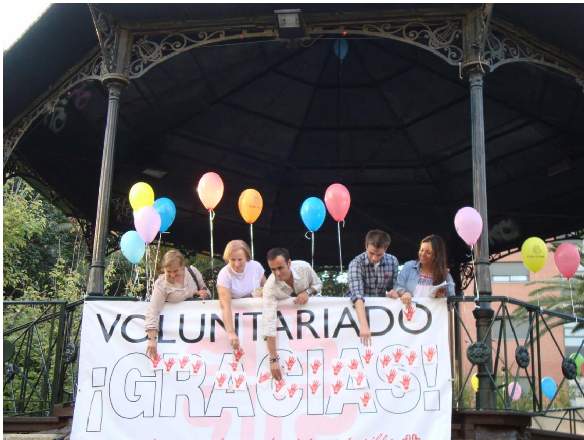
Kiosco de Cánovas acto del voluntariado organizado por Cáritas Diocesana.

Sólo me queda decirte muchas gracias, por la entrevista y desear que sigas así.